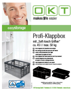
folder produktowy / product label