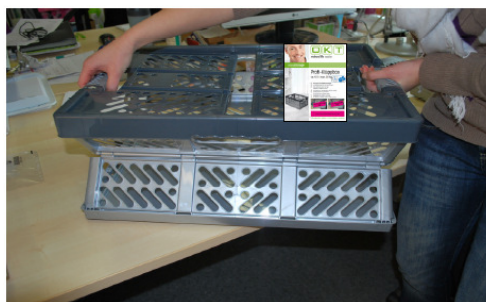
miejsce umieszczenia folderu / placement of product label